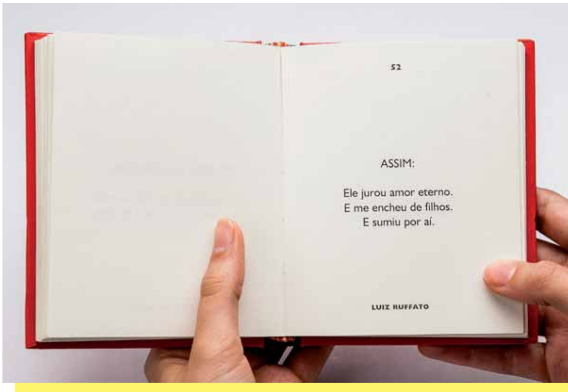
RUFFATO, Luiz. Assim. In: FREIRE, Marcelino (Org.). Os cem menores contos brasileiros do século . 3. ed. Cotia: Ateliê Editorial, 2004, p. 52.

3 Leia o miniconto a seguir e responda às questões propostas.