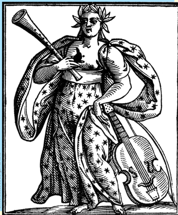
Emblema da poesia

RIPA, Cesare. Iconologia . Madri: Akal, 1996, p. 219.